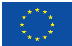
Kaasrahastanud Euroopa Liit