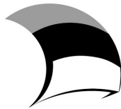
Eesti tuleviku heaks