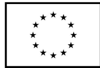
Kaasrahastanud Euroopa Liit